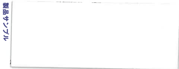
MAGFIT-01 ※裏面に透明の保護フィルムがついています

マグネットでメモなどをとめることができます。 平滑な面に吸着しますので、簡単に取り付けが可能です。